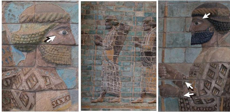
شکل ۲. قطعات آجر لعاب‌دار با نقوش کمانداران هخامنشی، یافت شده از محوطه شوش محل نگهداری موزه لوور فرانسه منبع: (نگارنگان، ۱۴۰۰). Fig. 2: Glazed brick fragments decorated with motifs of Achaemenid archers, excavated from the Susa site, currently housed in the Louvre Museum, France. (Authors, 2021).

کنزیاس نیز گزارشی ارائه کرده است که نشان می‌دهد در دربار هخامنشی، گروهی از زنان آرایشگر فعالیت داشتند. به روایت او، یکی از خواجه‌های داریوش دوم برای اجرای نقشه ترور، از زنی درخواست کرد تا ریش و سبیل مصنوعی بیافد و به او ظاهری مردانه ببخشد (بریان، ۱۳۸۵: ۵۸۱-۵۹۰).