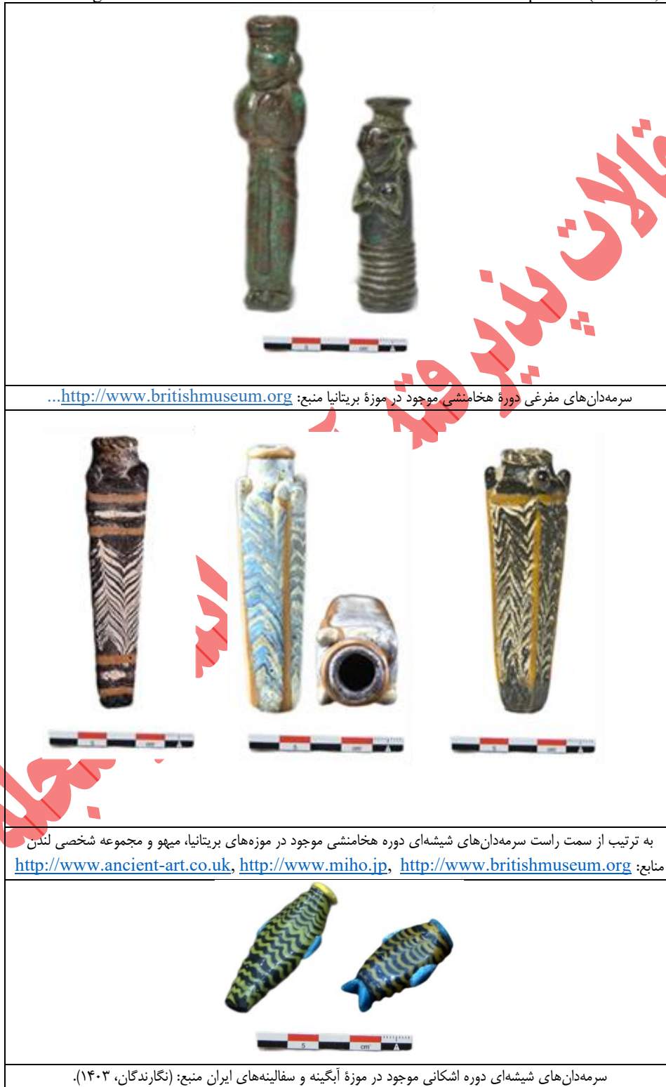
Table 1: Images of kohl containers from the Achaemenid and Parthian periods.

جدول ۱. تصاویر سرمه‌دان‌های دوره هخامنشی و اشکانی