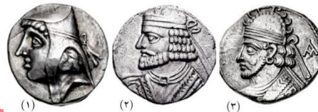
شکل ۵. به ترتیب از سمت چپ سکه ارشک دوم، بلاش یکم و پاکور دوم (Daryaei, 2012).

در خصوص آرایش مو، نقوش مهرها و سکه‌های اشکانی اطلاعات ارزشمندی ارائه می‌دهند. از دوره مهرداد اول به بعد، اغلب مردان اشکانی دارای ریش و زلف‌هایی مجعد و رها بوده‌اند. در مقابل، زنان معمولاً گیسوان بلند خود را یا به سبک یونانی از فرق وسط باز می‌کردند، یا آن‌ها را می‌بافته و با نیم تاج‌های فلزی و دستارهایی بلند می‌آراستند (Colledge, 1967: 91).