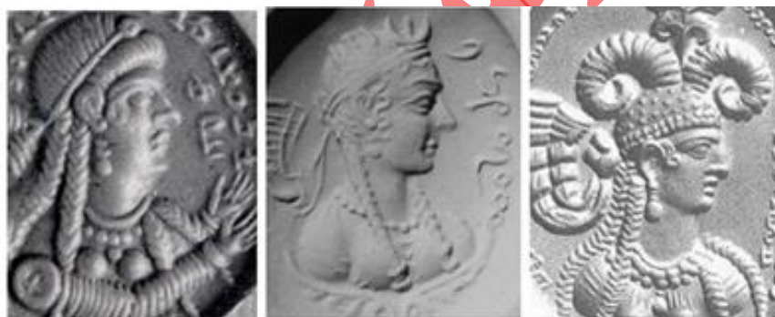
شکل ۶. اثر مهرهای دوره ساسانی با نوع آرایش مو منبع: https://www.britishmuseum.org .

۱۳۹۱: ۱۴۳). درباره شیوه آرایش مو، گیسوان بلند، با نوارهای موج‌دار و حلقه‌های تزئینی دور پیشانی از الگوهای رایج در میان زنان ساسانی به شمار می‌رفته است (محبی، ۱۳۹۳: ۲۰). این سبک آرایش مو را می‌توان در آثار متعدد برجای‌مانده از این دوره، از جمله در موزاییک‌های بیشاپور، نقش برجسته‌ها، اثر مهرها (شکل ۶) و سکه‌ها مشاهده کرد (گیرشمن، ۱۳۷۸: ۱۴۱-۱۴۷). در نقوش برجای‌مانده از مردان ساسانی نیز شواهدی از دقت در آرایش سر و صورت دیده می‌شود. در نقش برجسته‌های نقش رستم، فیروزآباد و سایر آثار، شاهان ساسانی ریش‌های نوکتیز خود را از درون حلقه‌ای عبور داده و موی سر را به صورت توده‌ای در بالای سر جمع کرده‌اند و بدین ترتیب، کوریمبوی ساسانی را پدید آورده‌اند (جعفری دهقی، ۱۳۹۳: ۲۹۵). از سوی دیگر، صنعت عطرسازی در این دوره به شکوفایی چشمگیری رسید و برخی شهرها به تولید و مصرف انواع خاصی از عطرها شهرت یافتند. مستوفی از عطرها نیلوفر، بنفشه، یاسمن و نرگس تولید شده در شهر بیشاپور یاد کرده است (لسترنج، ۱۳۷۷: ۲۸۴). همچنین، اصطخری به تولید و صادرات گلاب در شهر جور فارس اشاره کرده که به دلیل کیفیت بالا، افزون بر مصرف داخلی، به دیگر کشورها نیز صادر می‌شده است (اصطخری، ۱۳۴۷). ابن حوقل نیز از تولید عطرها روغنی در شاپور و صادرات گسترده آن‌ها یاد کرده و این امر را نشانه‌ای از رونق صنعت عطرسازی در فارس دانسته است (ابن حوقل، ۱۳۴۵: ۶۵).