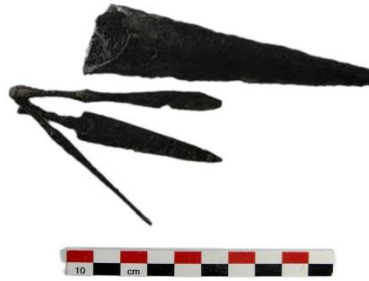
شکل ۸. مجموعه ابزار آرایشی و بهداشتی ناخن دوره ساسانی