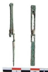
شکل ۷. تصویر موچین دوره ساسانی موجود در موزه پرگامون .

در جریان کاوش‌های باستان‌شناختی تیسفون، نمونه‌ای از موچین مفرغی-مسی متعلق به دوره ساسانی به دست آمده است. این اثر با استفاده از روش ریخته‌گری ساخته شده و ساختار آن از یک نوار فلزی تا شده در میانه تشکیل شده که دو بازوی متقارن پدید آورده است. طول کلی موچین حدود ۱۶ سانتی‌متر، ارتفاع هر بازو ۷/۹ سانتی‌متر و پهنا ۰/۷ سانتی‌متر گزارش شده است (شکل ۷) (رضایی، ۱۴۰۳).