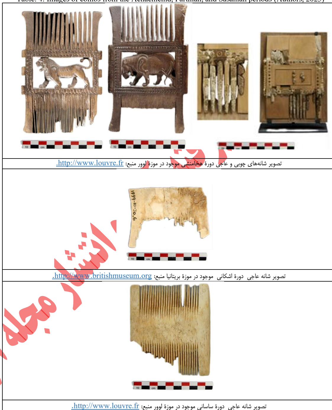
Table. 4: Images of combs from the Achaemenid, Parthian, and Sasanian periods (Authors, 2025)

جدول ۴. تصاویر شانه‌های دوره هخامنشی، اشکانی و ساسانی منبع: (نگارندگان، ۱۴۰۴)