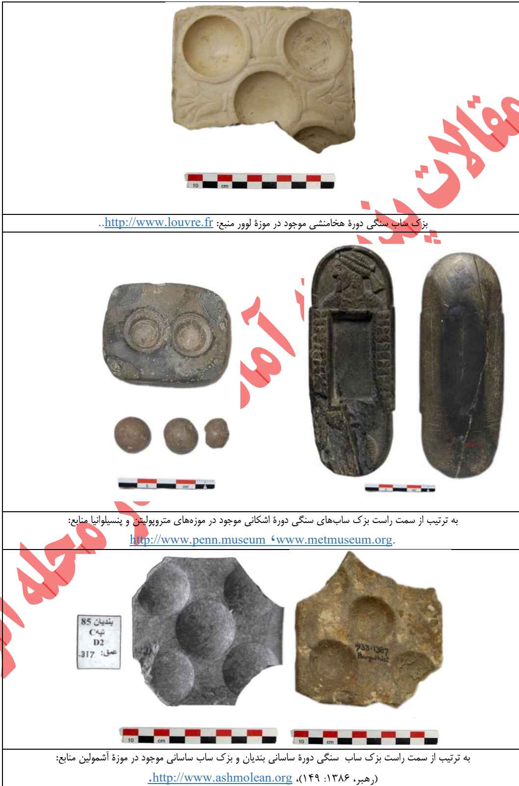
Table 2: Images of cosmetic grinders from the Achaemenid, Parthian, and Sasanian periods (Authors, 2025).

جدول ۲. تصاویر بزک ساب‌های دوره هخامنشی، اشکانی و ساسانی منبع: (نگارندگان، ۱۴۰۴).